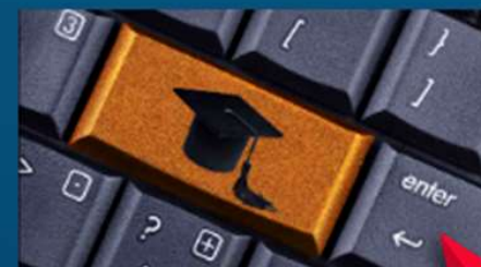
Подать электронное заявление