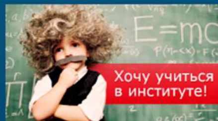
Приемная комиссия ДонГУ